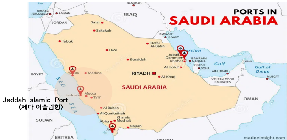
Maersk-DP World 공동 지분 구조로 운영되는 제다항 남부 컨테이너 터미널(SCT)